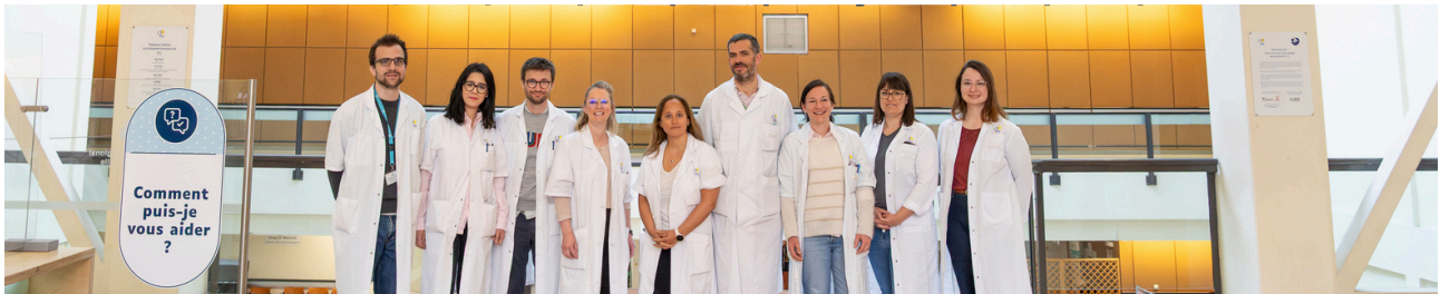
QUELQUES MEMBRES DE L'ÉQUIPE RECHERCHE DU PR. PIESSEN